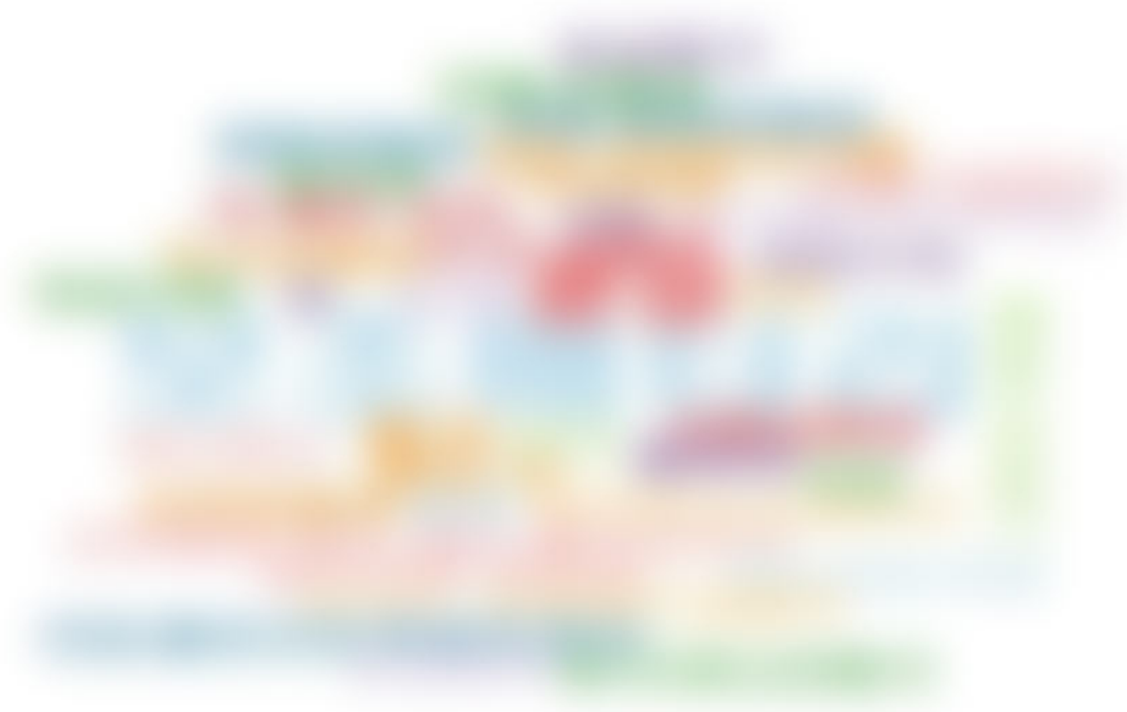
그림15 기념품에 대해 불만족(①+②)하는 대상자가 희망하는 기념품 (n=85, 전체 응답자 기준)

■ [기억, 추억, 선물, 감사, 사랑, 행복, 건강, 성공, 희망, 꿈, 노력, 도전, 열정, 끈기, 인내, 용기, 사랑, 감사, 기억, 추억, 선물, 행복, 건강, 성공, 희망, 꿈, 노력, 도전, 열정, 끈기, 인내, 용기]