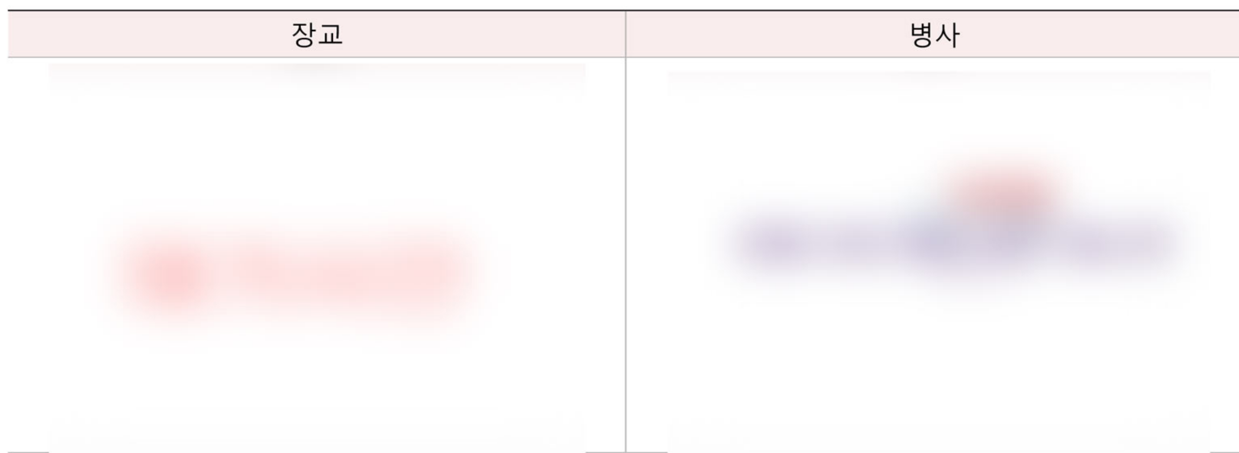
그림13 계급에 따른 헌혈 환경 불만족(①+②) 이유 (n=5, 전체 응답자 기준)